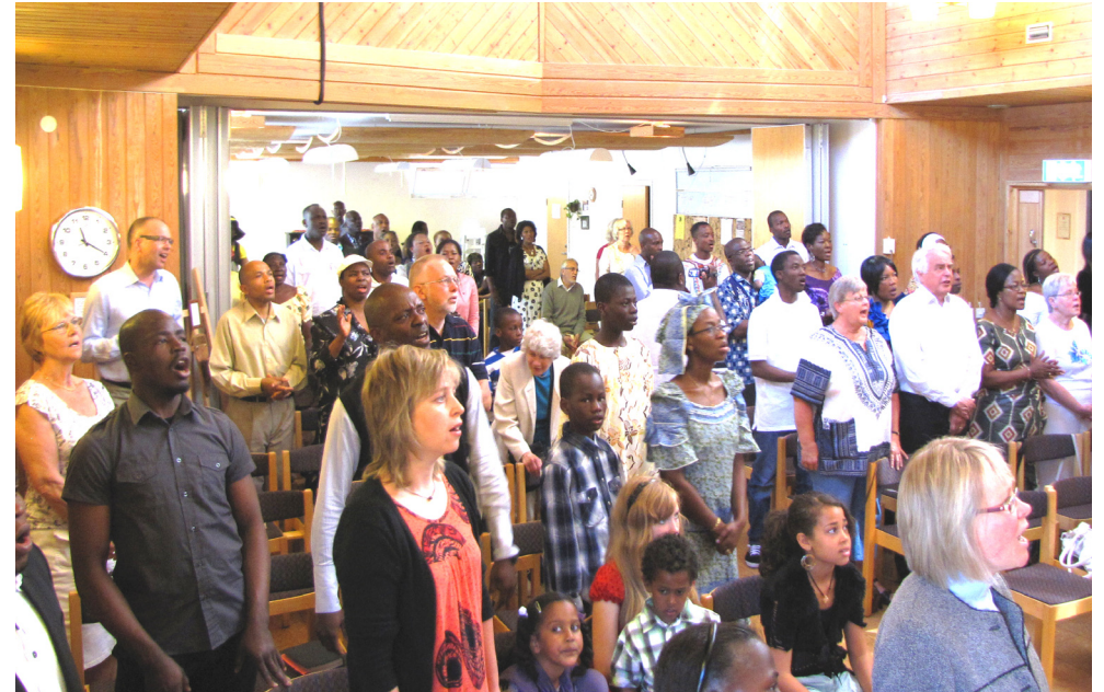
Lovsång i Hallundakyrkan